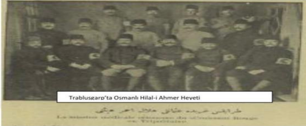
Trablusgarp'ta Osmanlı Hilal-i Ahmer Heveti

Ek.15. Trablusgarp'a görevlendirilen OHAC sağlık heyeti. (Servet-i Fünun Dergisinin 1082. Sayısının 129. Sayfasından alınmıştır.)