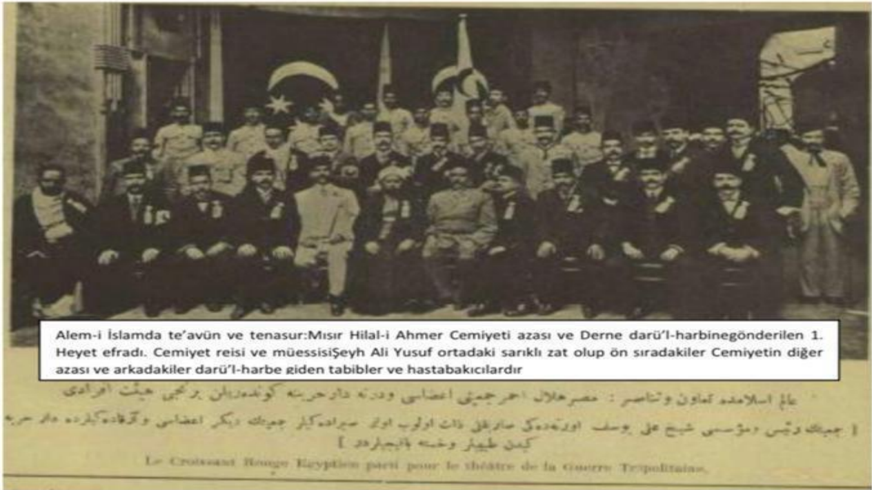
Alem-i İslamda te'avün ve tenasur: Mısır Hilal-i Ahmer Cemiyeti azası ve Derne darü'l-harbine gönderilen 1. Heyet efradı. Cemiyet reisi ve müessisi Şeyh Ali Yusuf ortadaki sarıklı zat olup ön sıradakiler Cemiyetin diğer azası ve arkadakiler darü'l-harbe giden tabibler ve hastabakıcılarıdır

Ek.16. Mısır Hilal-i Ahmer Cemiyeti'nin reisi ve üyeleri ile Derne'ye gönderilen Birinci Sağlık Heyetine mensup doktor ve hastabakıcılar. (Servet-i Fünun Dergisinin 5 Ocak 1912 tarihli 1074. Sayısının kapak sayfasından alınmıştır.)