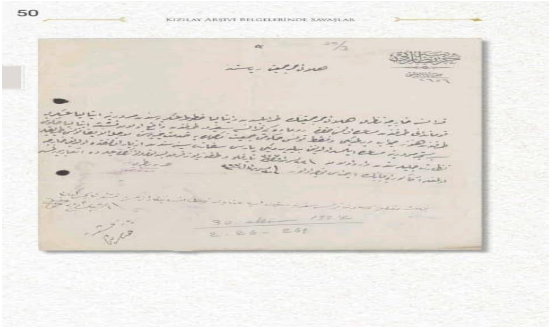
وثيقة 2: إفاد الوفد الأول لجمعية الهلال الأحمر، الذي نُظّم في مصر، إلى مدينة طبرق، مع اعتراف الجمعية إرسال وفد ثانٍ إلى كل من درنة وبنغازي.