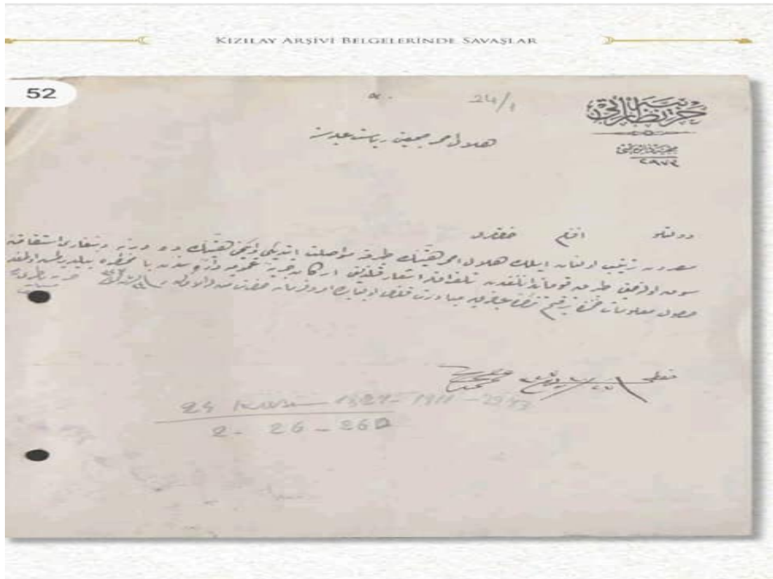
وثيقة 3: الحرص على اختيار أشخاص مخلصين وأكفاء لقيادة وفود الهلال الأحمر التي سترسل إلى طرابلس الغرب.